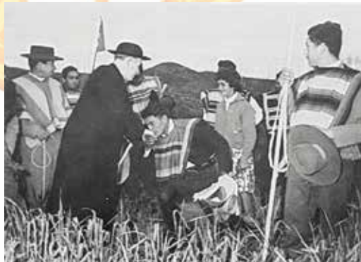
A la izquierda: La iglesia de Santiago, liderada por el Cardenal Raúl Silva Henríquez, apoyó el proceso de Reforma Agraria y entregó propiedades del Arzobispado de Santiago.

La Corporación Cultural también recordó esta acción que produjo el principal cambio cultural del siglo pasado, con una exposición de fotografías que mostraron el proceso, exhibiendo imágenes de las condiciones precarias y de marginalidad en la que vivían los campesinos y sus familias; las actividades de promoción de la ley que efectuaron las autoridades de la época, en terreno; y las imágenes del día en que se firmó la ley, en la Plaza de la Constitución, con cientos de campesinos aprobando y aplaudiendo la norma legal que vino a cambiar para siempre sus vidas y las de sus familias.