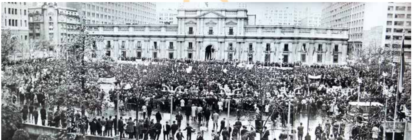
Abajo: Promulgación de la Ley de reforma Agraria en la Plaza de la Constitución.