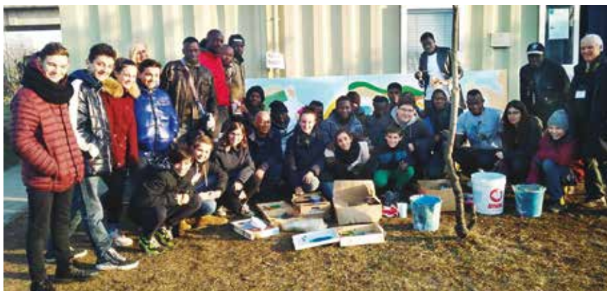
Participantes en la elaboración de mural realizado en un centro de prófugos en la ciudad de Turín.

Cuenta una experiencia personal que ejemplifica sus afirmaciones anteriores: “En una de las oportunidades que estaba en Chile me invitaron a contar la historia de la creación del “Primer gol del pueblo chileno”. El teatro, con el mural de Matta al fondo, estaba repleto de jóvenes y niños de las escuelas de la comuna”.