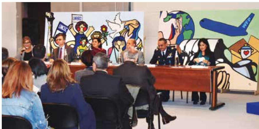
Visita de el presidente de la Cámara de diputados de Italia al Centro ONU de Brindisi; atrás dos paneles realizados con más de 150 estudiantes el día de la Naciones Unidas (24 de Octubre 2017).