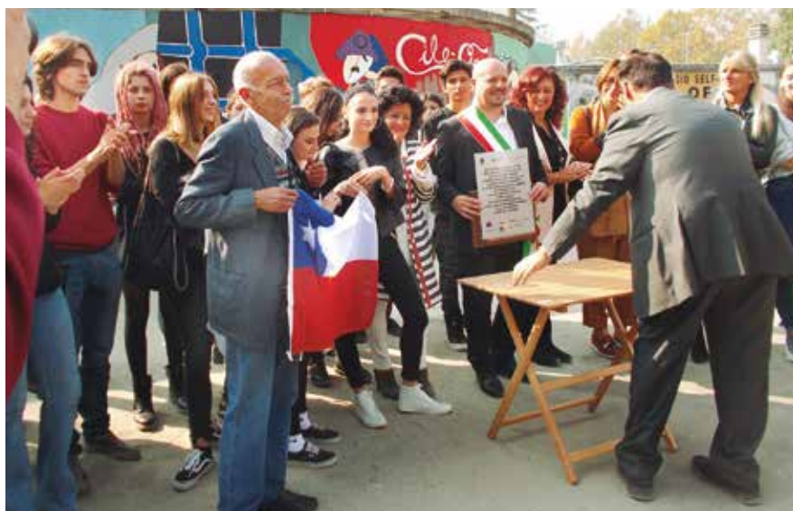
Inauguración de mural realizado en la ciudad de Forlì con los estudiantes del Liceo Artístico y musical de esa ciudad.