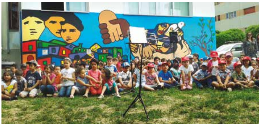
Mural realizado con los estudiantes de la escuela primaria multi étnica “Salvador Allende” de la ciudad de Mantova, con más de 120 niños de diferentes nacionalidades.