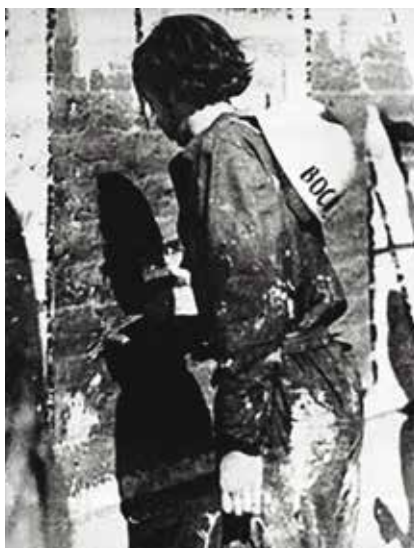
Fotografía captada por Eduardo Carrasco y publicada en el diario El Mercurio. Más tarde sería reproducida en una publicación de la Junta Militar llamada “Chile: ayer y hoy”.

Tras el golpe, el “Mono” Carrasco llega a Italia como refugiado político en 1974. La solidaridad hacia Chile unía el pintor consagrado con joven muralista: “Hacíamos recuerdos de esa experiencia, pero también hablamos del futuro del muralismo en Chile y en América Latina, en ese entonces un arte suspendido por las dictaduras en nuestro Continente”, acota el artista.