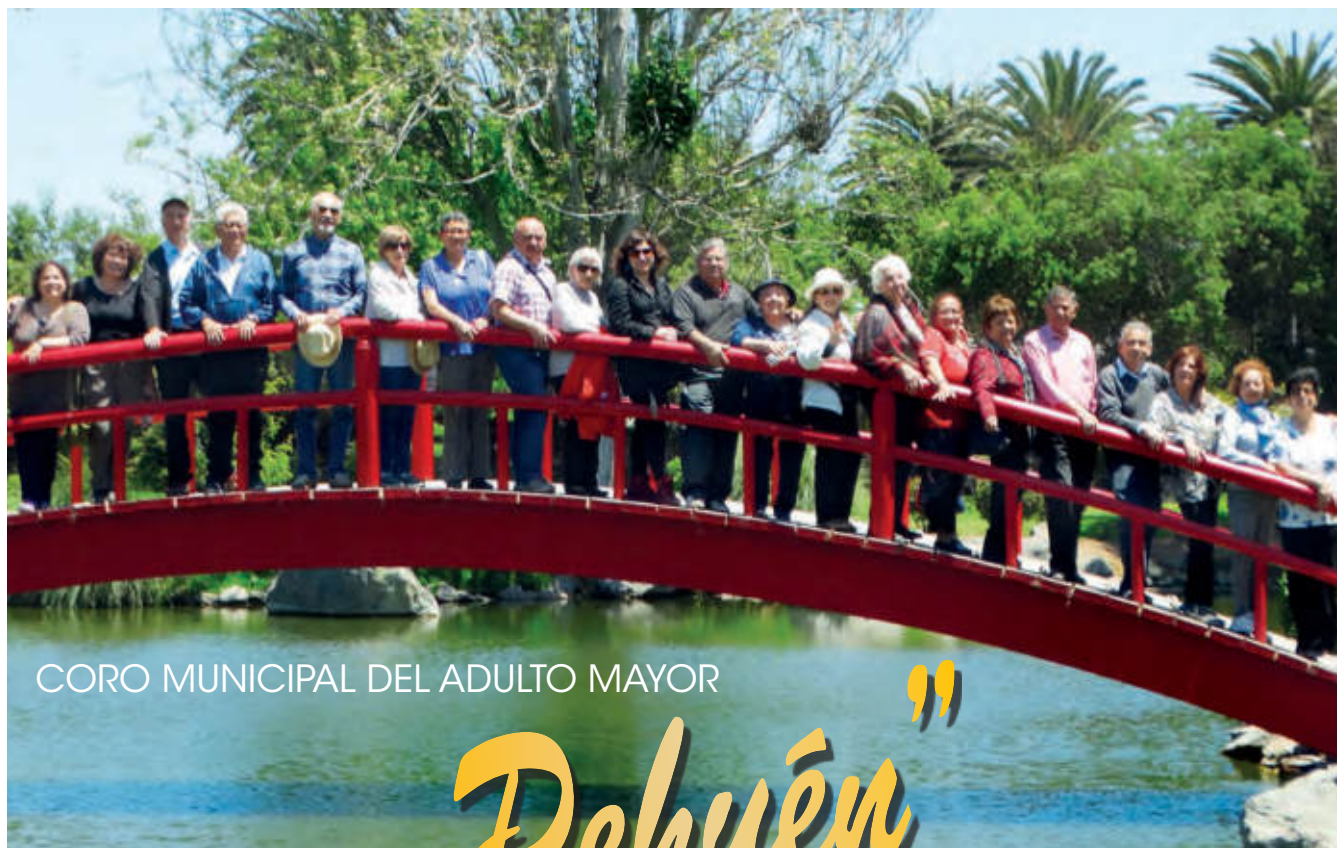
CORO MUNICIPAL DEL ADULTO MAYOR